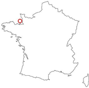
Archipel de Chausey