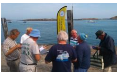
Animation sur la Grande Cale de Chausey en août 2016

Des stagiaires et service civique ont participé à l'animation du programme sur le terrain (capitainerie de Granville, Grande Cale et plan d'eau de Chausey) en 2017 et 2018. Une stagiaire en communication a travaillé sur les outils lors d'un stage de deux mois en 2016.