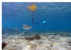
Carry le Rouet - ligne de mouillage complète

Responsable : Benjamin Cadville Tél : 04 42 45 45 07 cadville.benjamin@parcmarincotebleue.fr